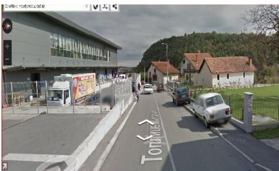
Ул. Милана Топлице