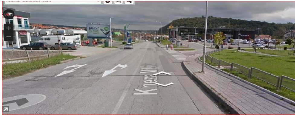
Ул. Кнеза Михаила