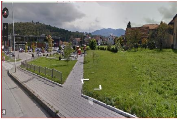
Зеленило – Парк